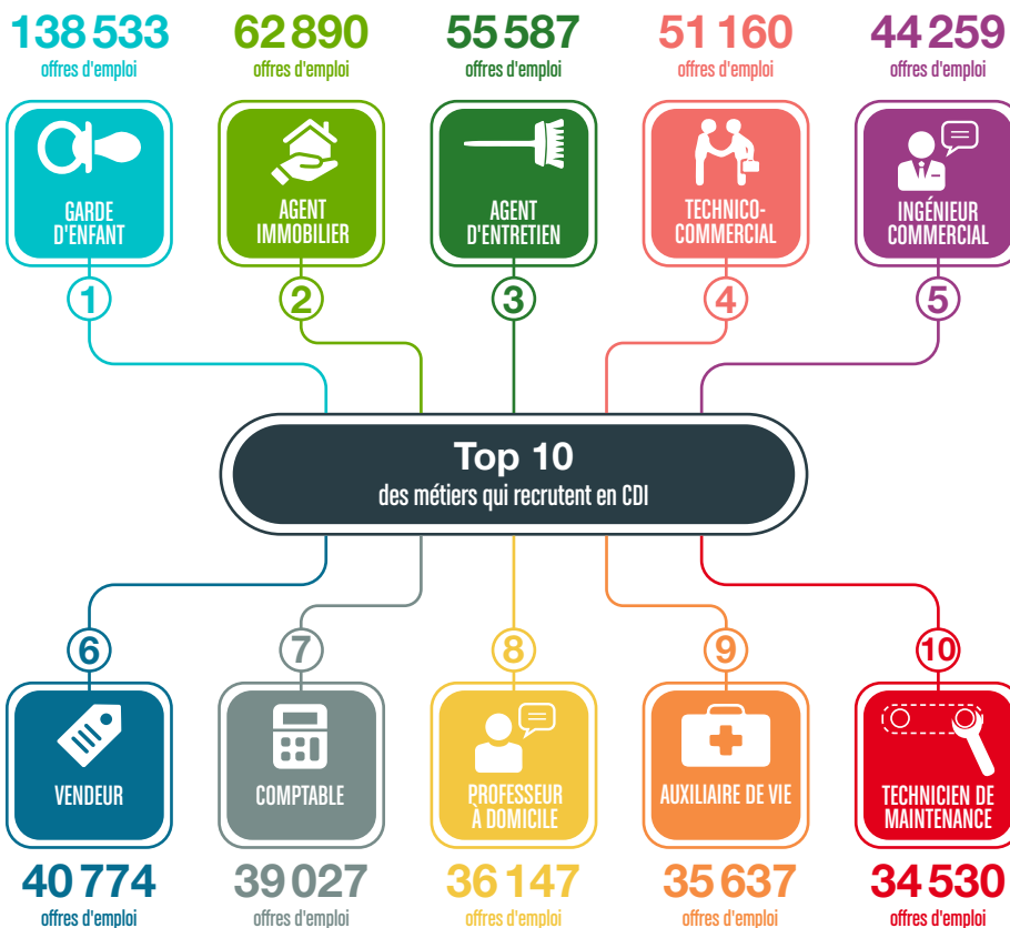
Offres d'emploi publiées entre le 1 er janvier et le 10 décembre 2021