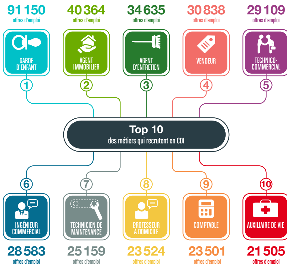
Offres d'emploi publiées entre le 1 er janvier et le 31 août 2021