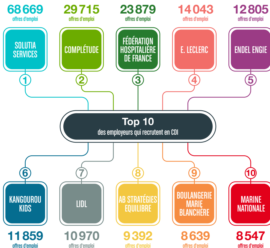
Offres d'emploi publiées entre le 1 er janvier et le 31 août 2021