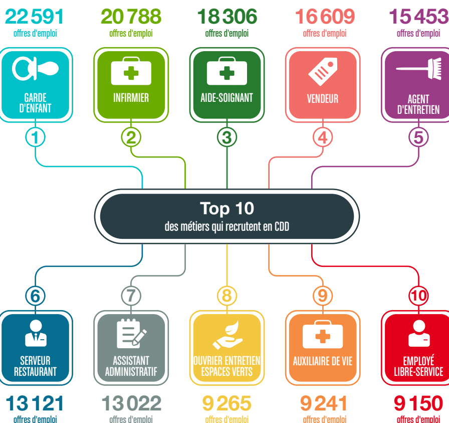
Offres d'emploi publiées entre le 1 er janvier et le 31 août 2021